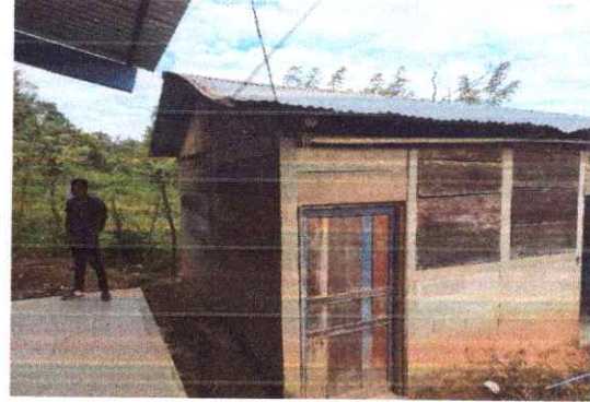
SUSTITUCION DE LAMINAS