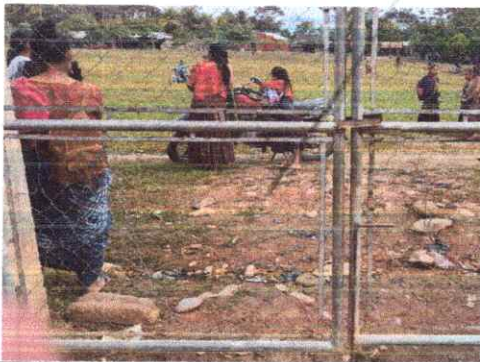
SUSTITUCION DE PORTON

Observación: Si es necesario se pueden agregar hojas adicionales y actualizar el número de hojas.