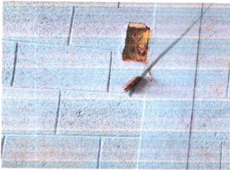
SUSTITUCION DE TOMA CORRIENTES