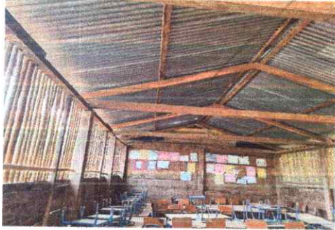
SUSTITUCIÓN DE ESTRUCTURA METALICA