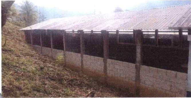
FOTO: LAMINAS ACANALADAS EN MAL ESTADO.