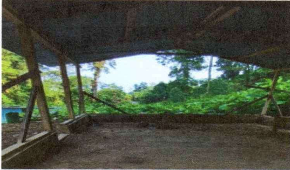
Foto1: Sustitución de lámina, por lámina troquelada aluzinc calibre 26.