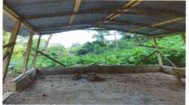
Foto 2: Sustitución de estructura de soporte de madera, por metal.