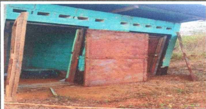
Foto. No. 3. sustitución de puertas en servivios sanitarios