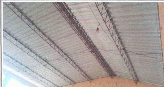
Foto No. 2. Sustitución de estructura de soporte de metal por metal.