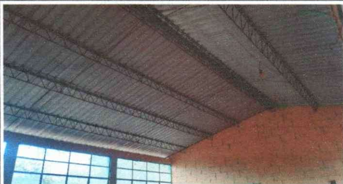
Foto No. 1 Sustitución de lámina, por lámina troquelada aluzinc calibre 26