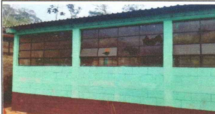
Foto No. 4. Sustitución de balcones de metal