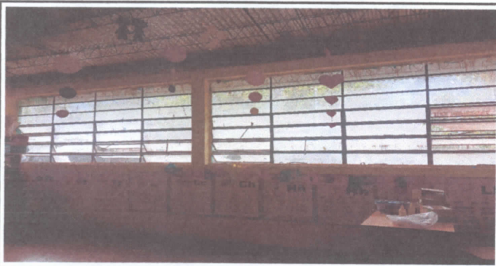
Cambios de ventanas