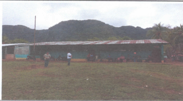
Cambio de láminas por laminas troqueladas y estructura metalicas