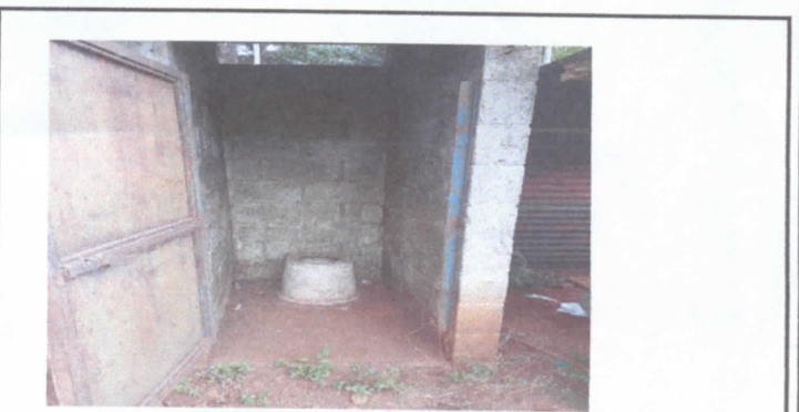
Cambios de inodoros

Observación: Si es necesario se pueden agregar hojas adicionales y actualizar el número de hojas.