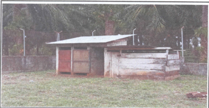
Mantenimiento de puertas