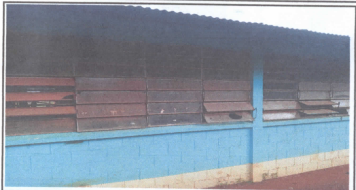
Cambio de ventanas por Valcones