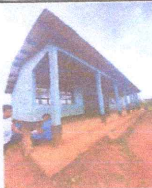
FOTO 2: Area deteriorada donde es obligatorio fundir banqueta para evitar que colapse el piso y las columnas de la escuela.