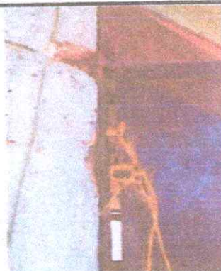
FOTO 4: Se observa una de las puertas deterioradas y necesita sustitución.