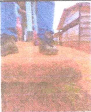
FOTO 1: Se puede observar área donde es necesario fundir banqueta para evitar que se deteriore más el piso en el corredor y contorno de las paredes de la escuela.