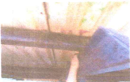
FOTO 3: Láminas y estructura de techo que necesitan sustitución o mantenimiento.