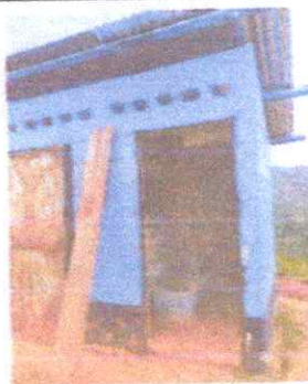
FOTO 6: Se puede observar puerta de los baños en mal estado. Es necesario sustituirlas.

Observación: Si es necesario se pueden agregar hojas adicionales y actualizar el número de hojas.