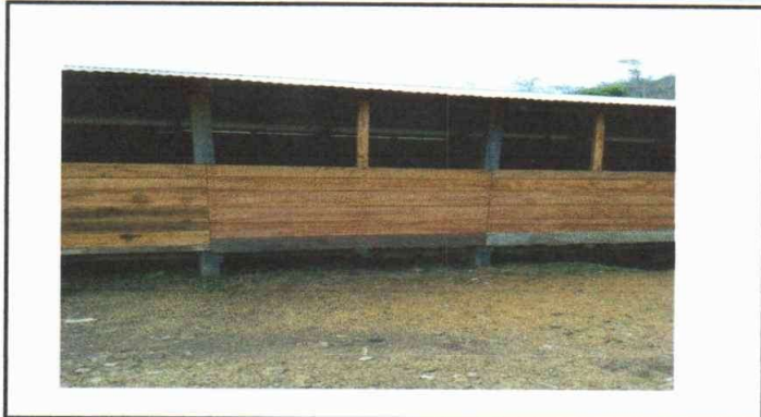
Foto1: Sustitución de lámina, por lámina troquelada aluzinc calibre 26