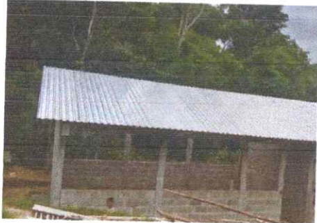
Foto 1: SUSTITUCIÓN DE LÁMINAS, POR LÁMINAS TROQUELADA ALUZINC CALIBRE 26