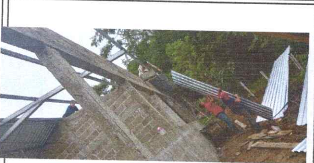
Foto 1: SUSTITUCIÓN DE LÁMINAS, POR LÁMINAS TROQUELADA ALUZINC CALIBRE 26