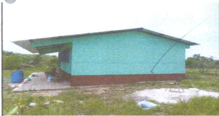
PINTURA EXTERIOR E INTERIOR