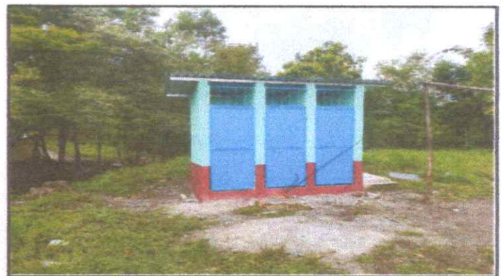
SUSTITUCION DE PUERTAS, INODORO SANITARIOS