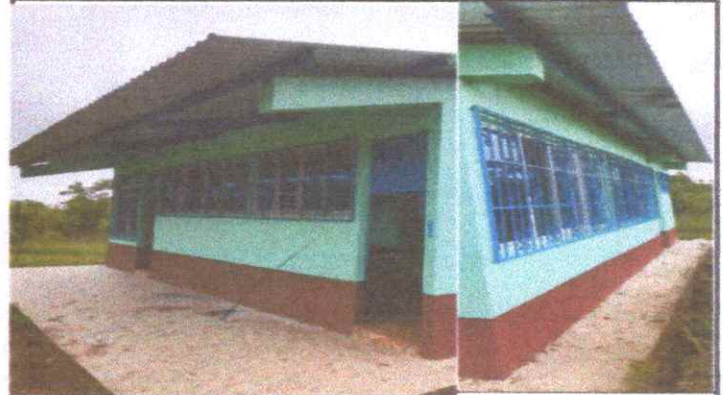
SUSTITUCION DE VENTANAS