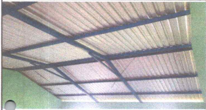
SUSTITUCION DE LAMINAS