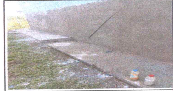
REPARACION DE BANQUETA

Observación: Si es necesario se pueden agregar hojas adicionales y actualizar el número de hojas.