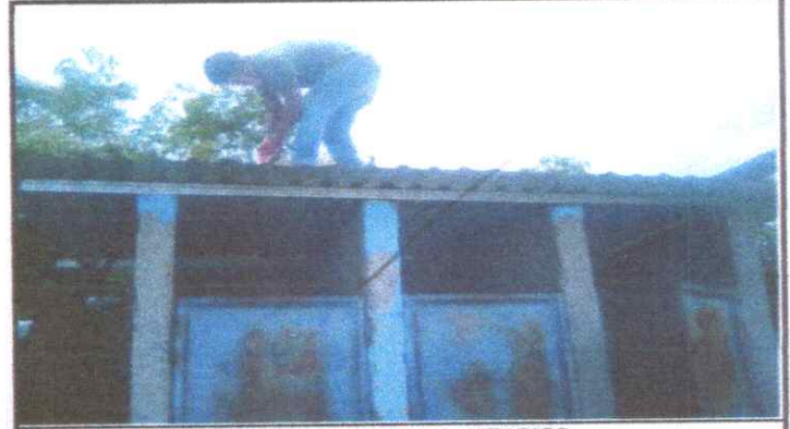
SUSTITUCION DE PUERTAS, INODORO SANITARIOS