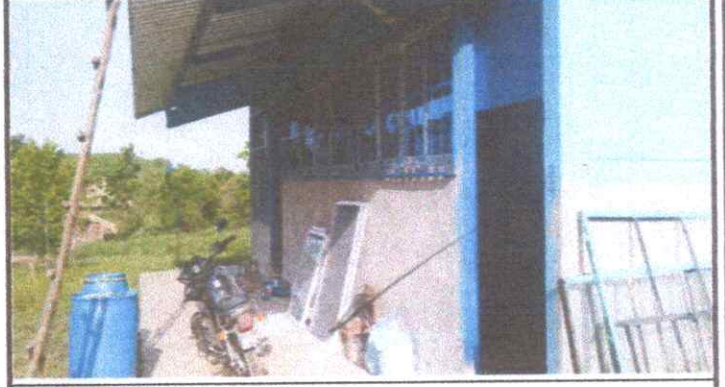
SUSTITUCION DE VENTANAS