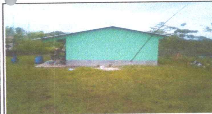
PINTURA EXTERIOR E INTERIOR