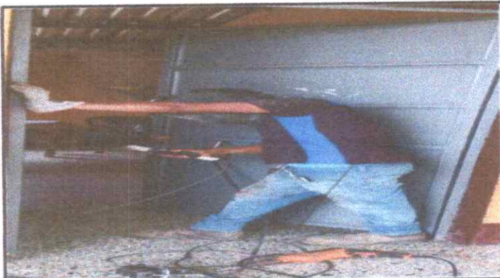
SUSTUCION DE CHAPA