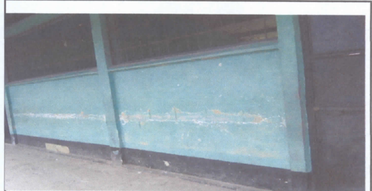
PINTADA DE PARED INTERIOR Y EXTERIOR DEL ESTABLECIMIENTO EDUCATIVO