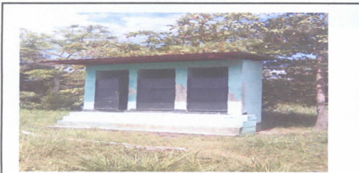
PINTURA DE MURO INTERIOR -EXTERIOR DE LETRINA Y PUERTAS