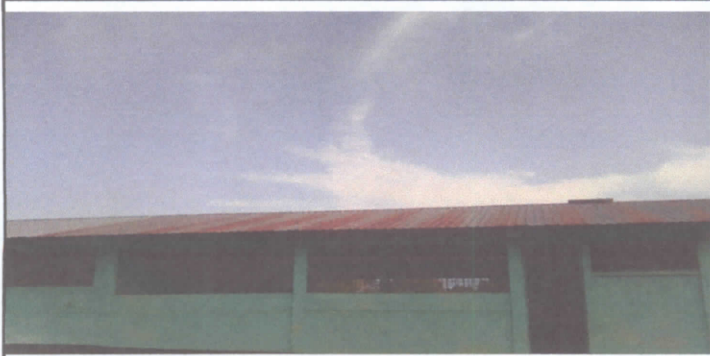
SUSTITUCION DE ESTRUCTURA DE TECHO Y LAMINAS