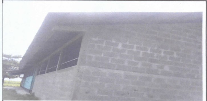
SUSTITUCION DE VENTANAS, PUERTAS Y REPELLO DE MURO INTERIOR Y EXTERIOR DEL ESTABLECIMIENTO EDUCATIVO