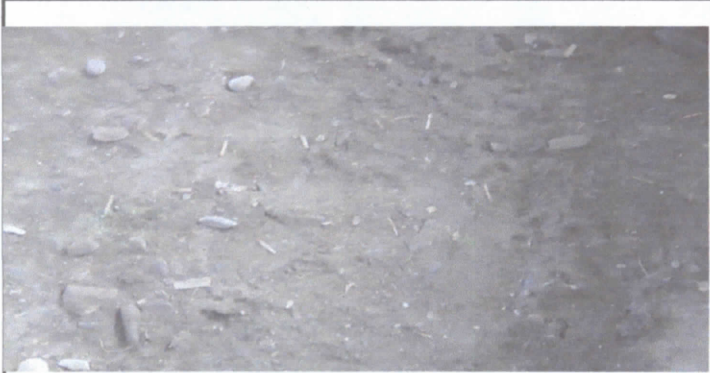
Tirado de piso con torta de cemento