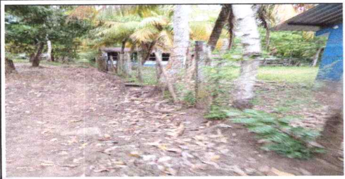
FOTO 5: REPARACIÓN DE MURO PERIMETRAL DE BLOCK CON TUBO HG Y MALLA GALVANIZADA, SOLERA INTERMEDIAS Y COLUMNAS.