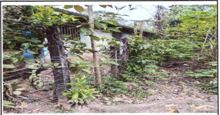
FOTO 6: REPARACIÓN DE MURO PERIMETRAL DE BLOCK CON TUBO HG Y MALLA GALVANIZADA, SOLERA INTERMEDIAS Y COLUMNAS.

Observación: Si es necesario se pueden agregar hojas adicionales y actualizar el número de hojas.