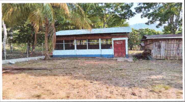
FOTO 2: SUSTITUCIÓN DE LAMINA, POR LÁMINA ACANALADA ALUZINC CALIBRE 28.