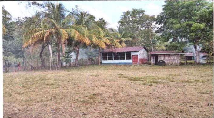
FOTO 1: SUSTITUCIÓN DE LAMINA, POR LÁMINA ACANALADA ALUZINC CALIBRE 28.