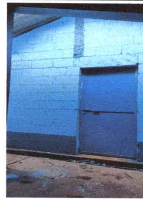
Foto 4: Mejoramiento de aula, con dos hiladas de block y levantada de culatas.

Observación: Si es necesario se pueden agregar hojas adicionales y actualizar el número de hojas.