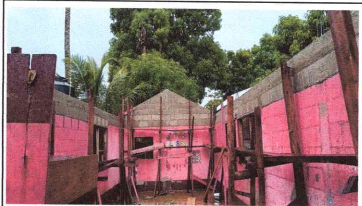
Foto 4: Mejoramiento de aula, con dos hiladas de block y levantado de culatas en la parte de enfrente y atrás.

Observación: Si es necesario se pueden agregar hojas adicionales y actualizar el número de hojas.