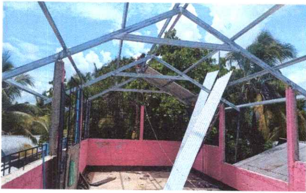
Foto 1: sustitución de estructura de soporte de madera por metal.