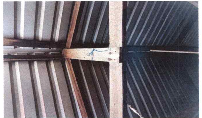
Foto4: Sustitución de estructura de soporte de madera por metal