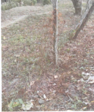
sustitución de cerco de malla por muro perimetral de block