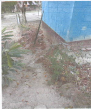
sustitución de cerco de malla por muro perimetral de block