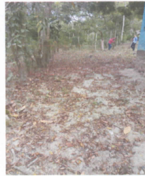
sustitución de cerco de malla por muro perimetral de block