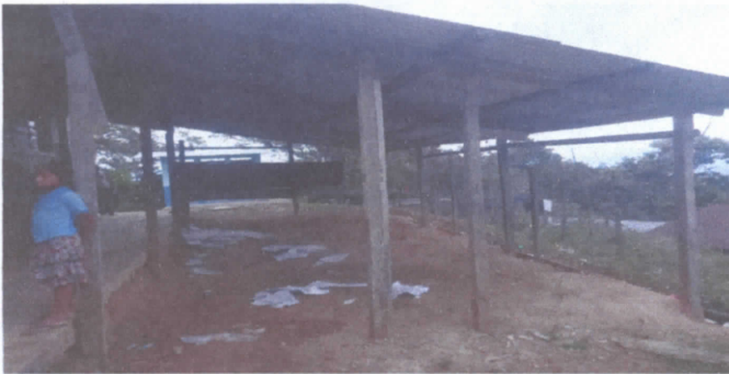
ESTRUCTURA EN MAL ESTADO