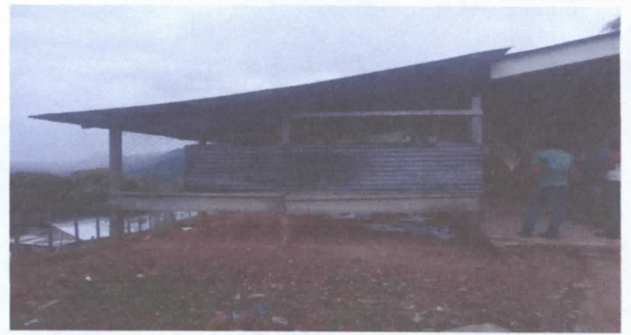
SUSTITUCION DE LAMINA ALUZIN POR LAMINA TROQUELADA LEGITIMA