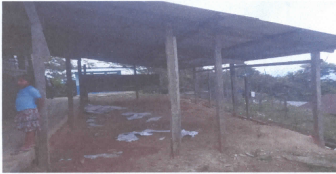
SUSTITUCION DE ESTRUCTURA DE TECHO