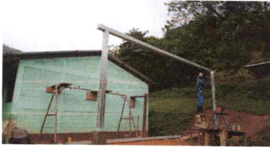
FOTO 9: INSTALACION DE ESTRUCTURA DE METAL PARA SOPORTE DE TECHO EN ESCENARIO