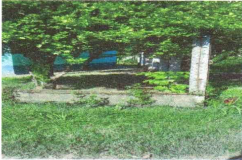
Foto 3: cambia de malla a blok de 111 metros de largo por muro de block

Observación: Si es necesario se pueden agregar hojas adicionales y actualizar el número de hojas.