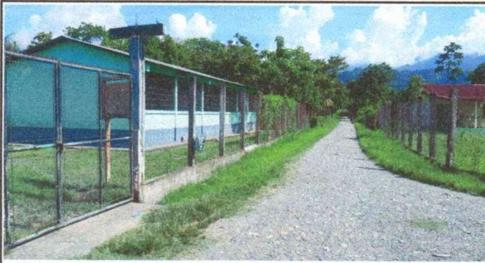
Foto1: Cambio de malla a block de 42 metros de largo por muro de block