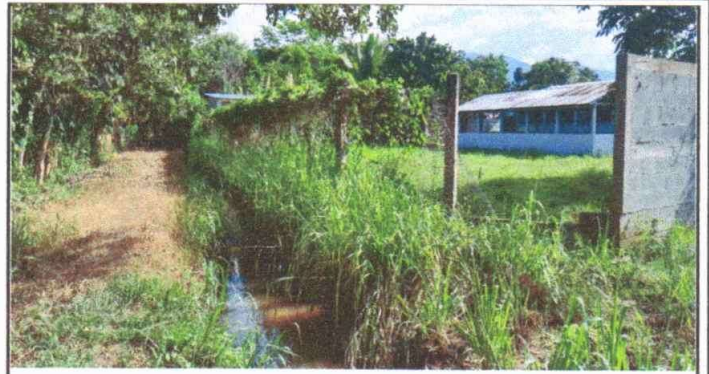
Foto 2: cambio de malla a blok de 49 metros de largo por muro de block