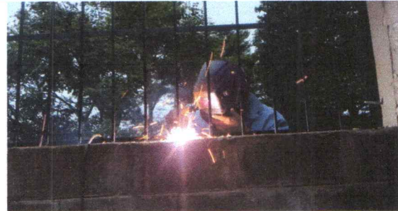
Foto 6: FABRICACION E INSTALACION DE BALCONES DE HIERRO EN VENTANA

Observación: Si es necesario se pueden agregar hojas adicionales. El número de hojas.