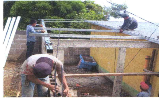
Foto 4: SUSTITUCIÓN DE ESTRUCTURA DE TECHO SOPORTE MADERA POR METAL