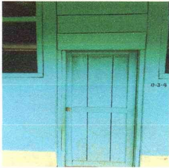
Foto1: Sustitución de puertas de maderas por puertas de metal.