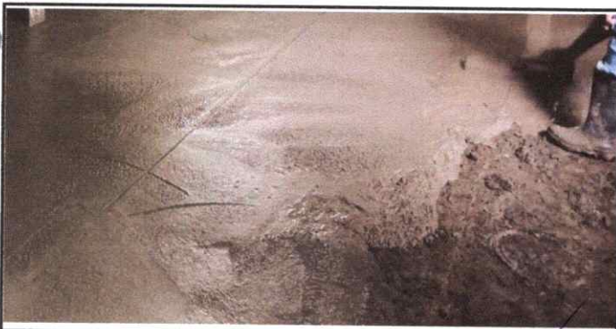
FOTO 5. SUSTITUCIÓN DE PISO DE CONCRETO.

Observación: Si es necesario se pueden agregar hojas adicionales y actualizar el número de hojas.