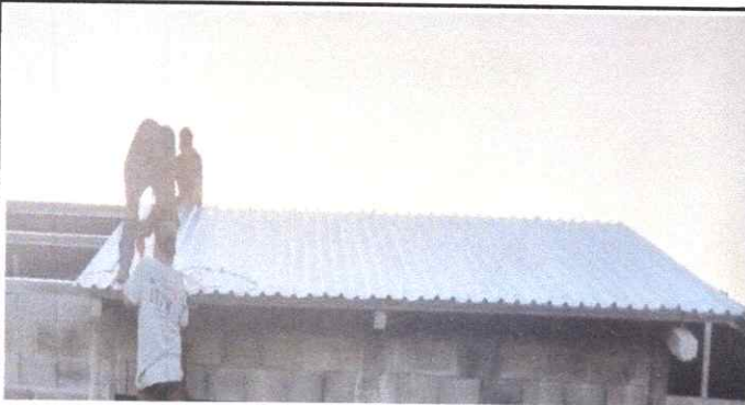
SUSTITUCIÓN DE LAMINAS.