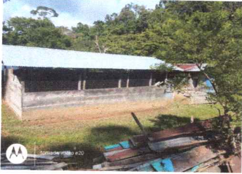
Foto 1: Sustrucción de Lámina, por lamina troquela aluzinc calibre 26