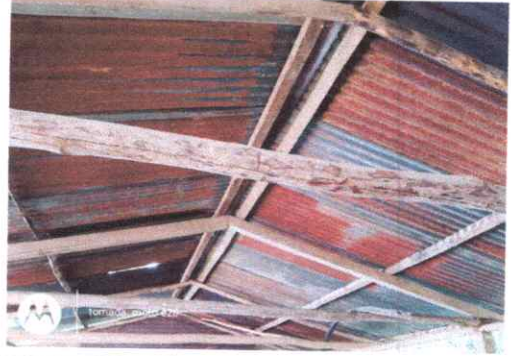
Foto 2: Sustrucción de estructura de soporte de madera, por metal