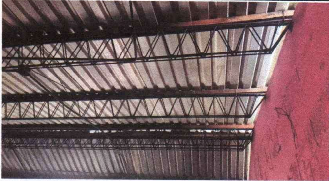
Foto1: Sustrucción de estructura de soporte de metal, por metal.