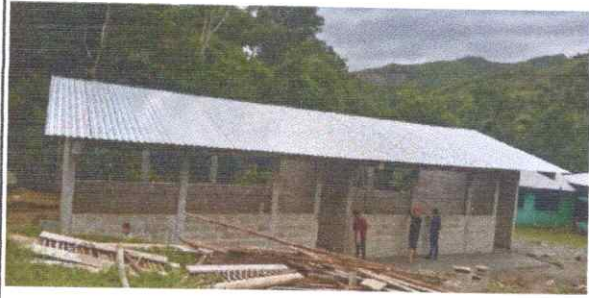
Foto 1: SUSTITUCIÓN DE LÁMINAS, POR LÁMINAS TROQUELADA ALUZINC CALIBRE 26