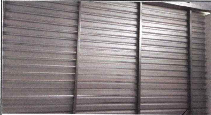
FOTO 1: Sustitución de lámina, por lámina troquelada aluzinc calibre 26