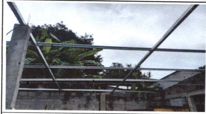
FOTO 1: Sustrucción de lámina, por lámina troquelada aluzinc calibre 26