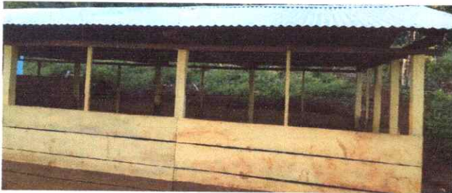
Foto 1: Sustitución de lámina, por lámina troquelada aluzinc calibre 26