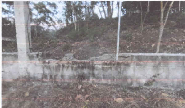
FOTO 3: Reparacion de muros perimetrales de block cun tubo y malla

Observación: Si es necesario se pueden agregar hojas adicionales y actualizar el número de hojas.