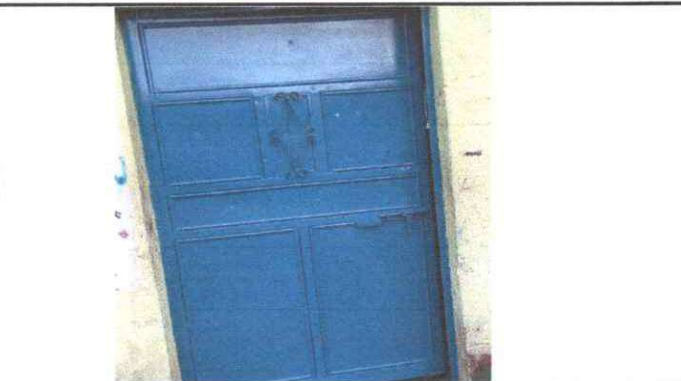
PUERTAS Y TUBERIAS