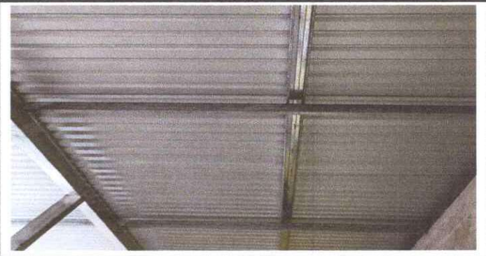
SUSTITUCIÓN DE ESTRUCTURA DE SOPORTE DE MADERA, POR METAL

Observación: Si es necesario se pueden agregar hojas adicionales y actualizar el número de hojas.