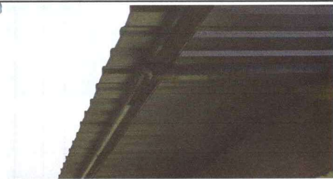
DETERIORO DEL TECHADO