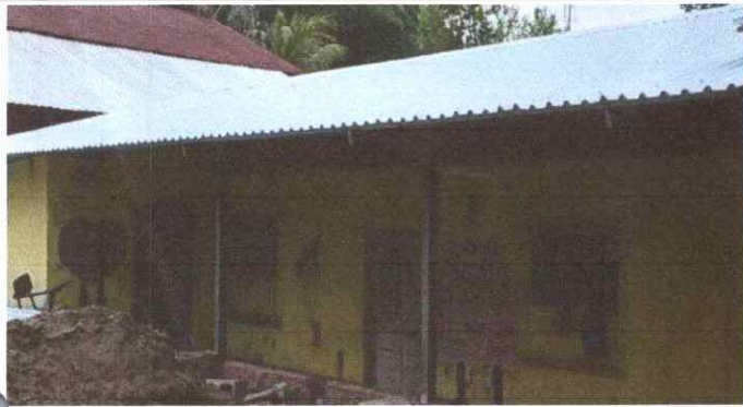
SUSTITUCIÓN DE LÁMINA, POR LÁMINA TROQUELADA ALUZINC CALIBRE 26