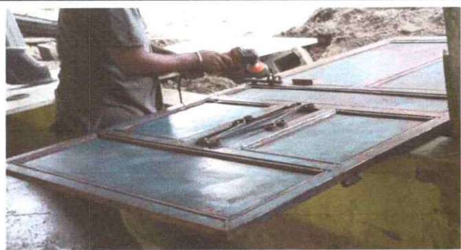
PUERTAS Y TUBERIAS