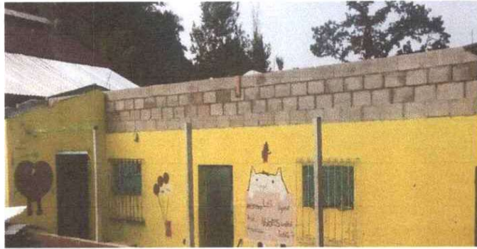
SUSTITUCIÓN DE LÁMINA, POR LÁMINA TROQUELADA ALUZINC CALIBRE 26