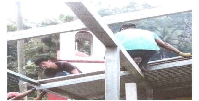
DETERIORO DEL TECHADO