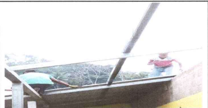
SUSTITUCIÓN DE ESTRUCTURA DE SOPORTE DE MADERA, POR METAL

Observación: Si es necesario se pueden agregar hojas adicionales y actualizar el número de hojas.