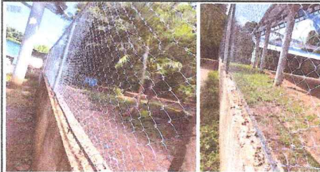
Foto1: Malla a sustituir en mal estado, oxidada y quebradas.