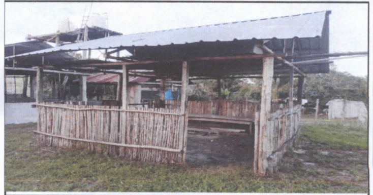
Reparación de piso de torta de concreto.