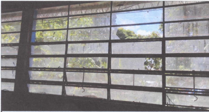
Sustitucion de estructura de metal de ventana