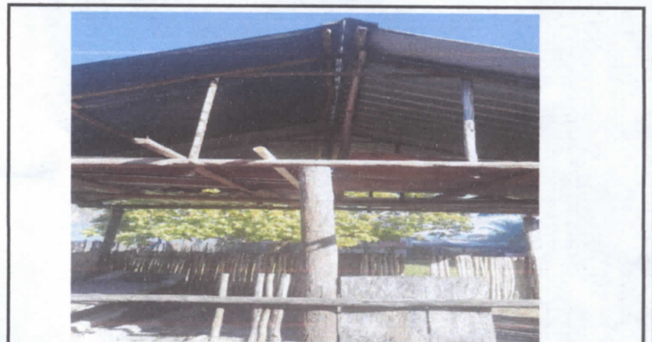
Estructura de techo