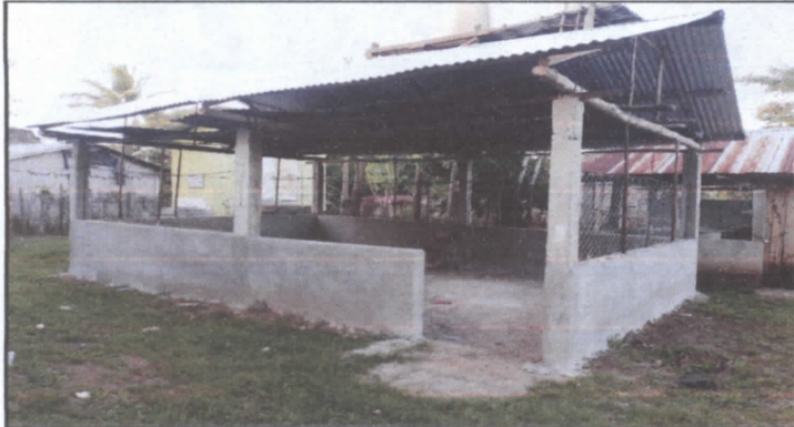
Sustitución de lámina, por lámina troquelada aluzin calibre26, sustitución de puerta y sustitución de balcones de metal