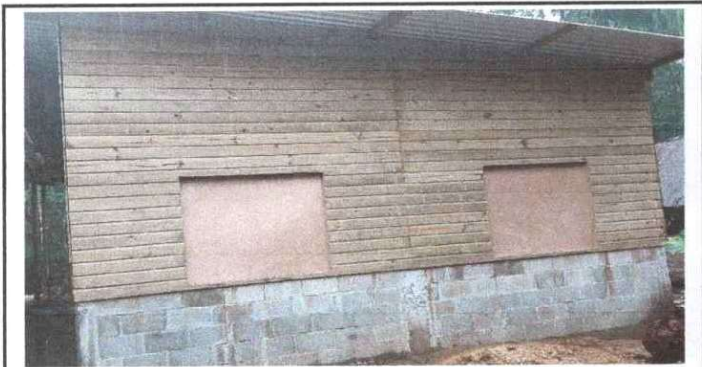
Sustitución de ventanas de madera del aula