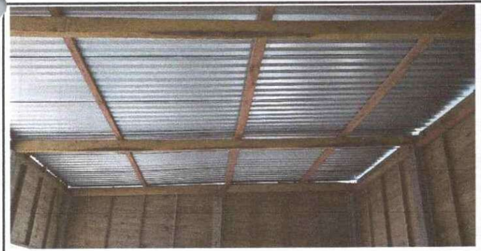
Sustitución de estructura de soporte de madera, por madera