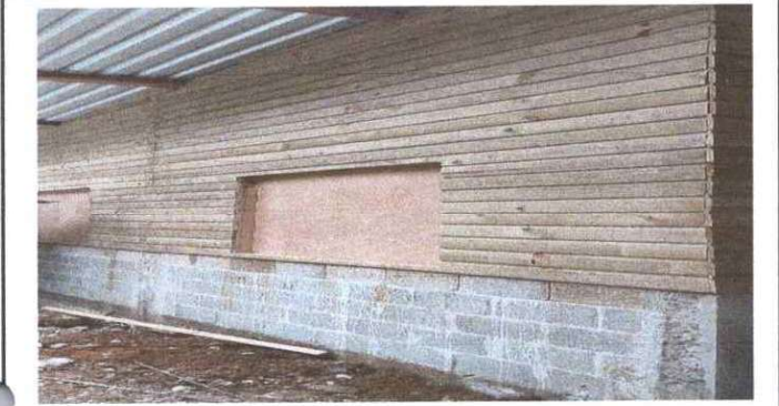
Sustitución de estructura de soporte de madera, por madera