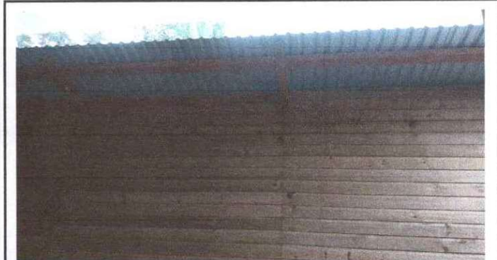
Circulación del aula mejoramiento con machimbre de madera