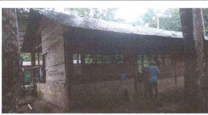
Circulación del aula mejoramiento con machimbre de madera