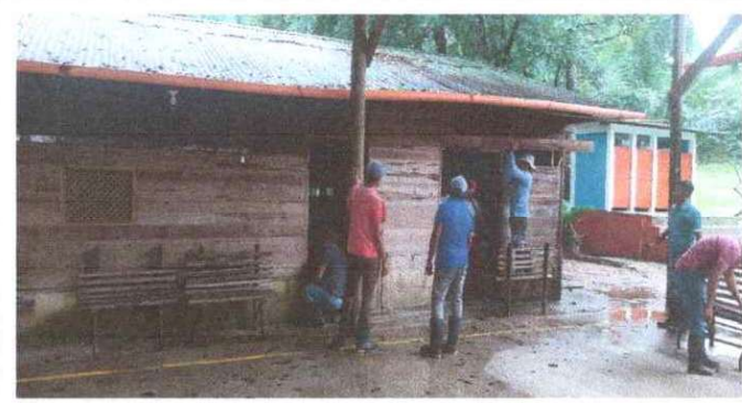
Sustitución de puertas de madera del aula