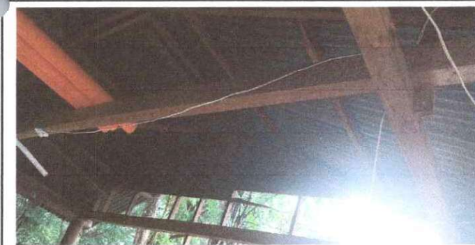
Sustitución de estructura de soporte de madera, por madera

Observación: Si es necesario se pueden agregar hojas adicionales y actualizar el número de hojas.