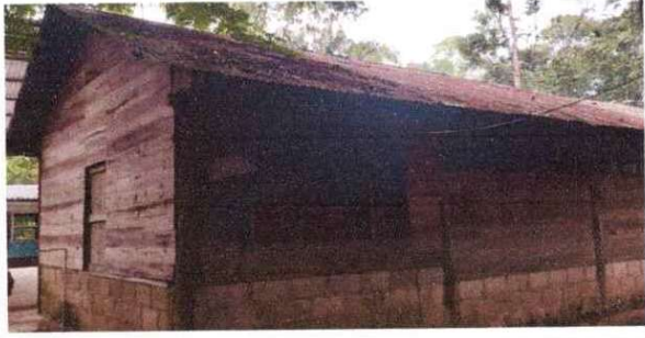
Foto 4: Circulación del aula mejoramiento con machimbre de madera.