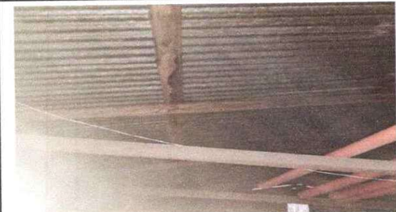
Foto 5: Sustitución de estructura de soporte de madera, por madera.