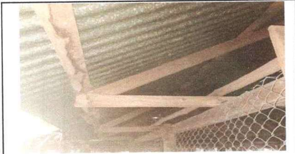
Foto1: Sustitución de estructura de soporte de madera, por madera.