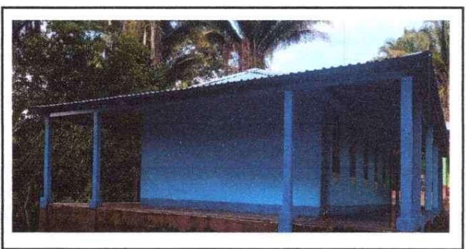
Foto 6: De ésta manera quedó la finalización del trabajo del remozamiento, el cual consta de cuatro corredores

Observación: Si es necesario se pueden agregar hojas adicionales y actualizar el número de hojas.