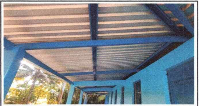
Foto 4: Aquí se evidencia el techo de estructura metálica del corredor