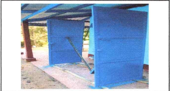
Foto 1: Las dos puertas que se elaboraron así quedaron de color azul.