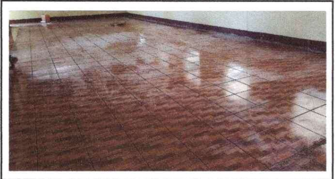
Foto 2: En esta foto se puede evidenciar como quedó la colocación del piso cerámico.