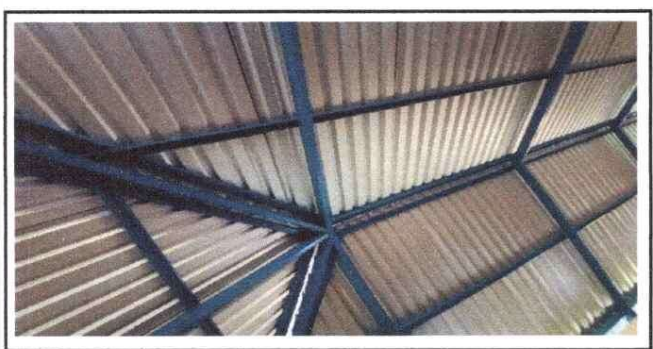
Foto 5: así quedó la estructura del techo metálico y la colocación de la lámina troquelada aluzinc calibre 26