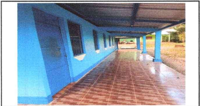
Foto 3: En esta fotografía se puede evidenciar como quedó el corredor con la cerámica.