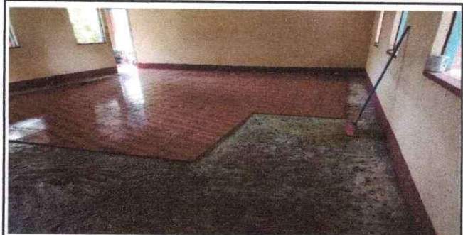
Foto 6: Colocación del piso cerámico, tanto como el de adentro y el corredor.

Observación: Si es necesario se pueden agregar hojas adicionales y actualizar el número de hojas.