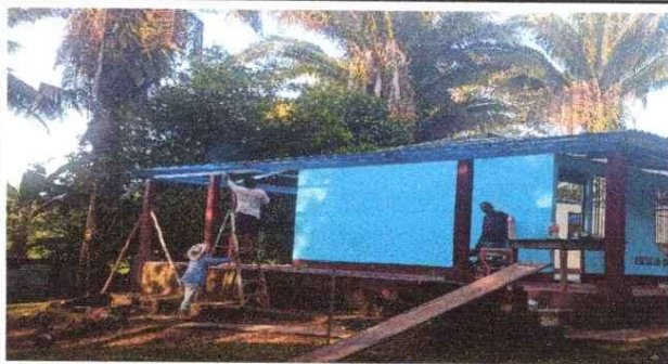
Foto 3: Cuando se pinto la estructura metálica; tijeras y costaneras con color azul.