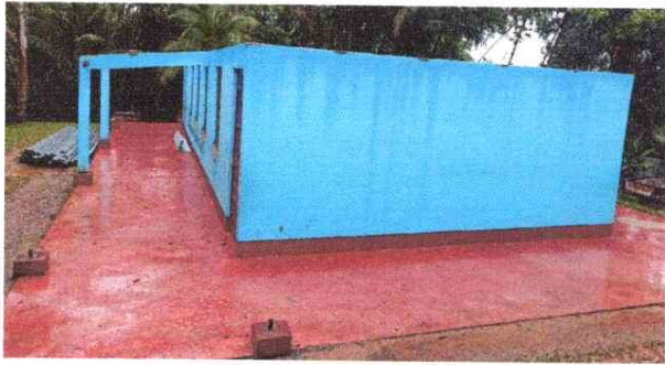
Foto 1: Aquí se puede observar que el edificio aun no le han colocado las estructuras del techo.