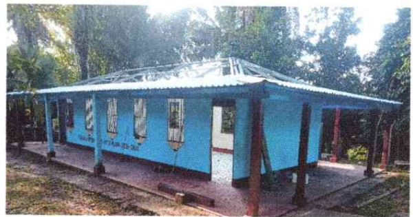
Foto 4: En esta parte se puede observar la colocacion de la lámina troquelada aluzinc.