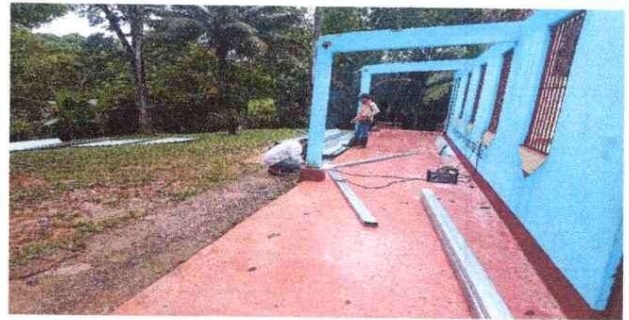
Foto 2: cuando se empezó a soldar la estructura del techo metálica, tijeras y costaneras.