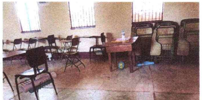
cambio de pintura de la pared de adentro de la escuela