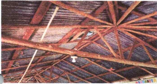
El techo se va cambiar de madera por estructura de metal