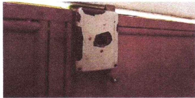
cambio de puerta de metal por metal, porque se encuentra en mal estado.