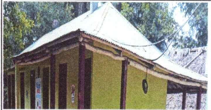
Sustituto de lámina, por lamina troquelada aluzinc calibre 26, la actual se encuentra en mal estado.