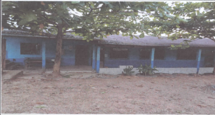
FOTO 1: Sustitución de lámina, por lamina troquelada aluzinc calibre 26