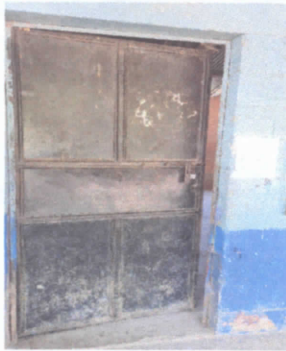
FOTO 3: Mantenimiento a estructura (lija, cambio de tubo, cepillado, sujeciones, aplicaciones de pintura)