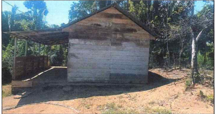
Foto 4: Ausencia de gradas en la entrada principal de la escuela.