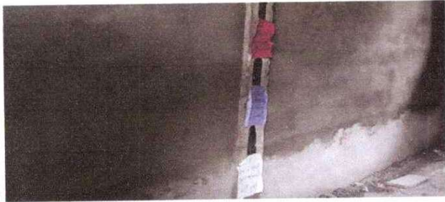
REPARACION DE MURO PERIMETRAL DE BLOCK CON TUBO HG Y Malla GALVANIZADA