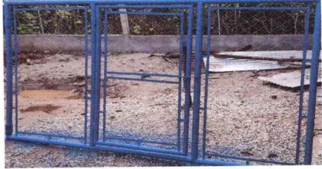
SUSTITUCION A PORTON DE METAL