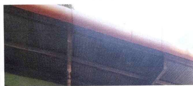
INSTALACION DE CANALES DE TUVO PVC 3"