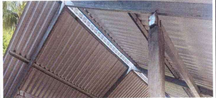
Sustitución de estructura de soporte de madera, por metal (cocina)