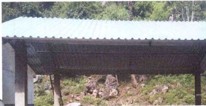
Sustitución de lámina, por lámina troquelada aluzinc calibre 26 (cocina)