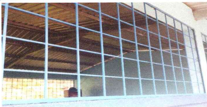
Mantenimiento a balcones de metal