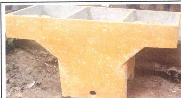
Sustitución de pila de cemento de dos lavadero