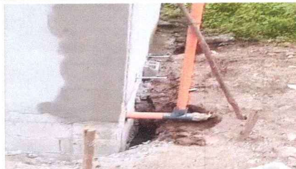
Limpieza de Fosa Séptica

Observación: Si es necesario se pueden agregar hojas adicionales y actualizar el número de hojas.