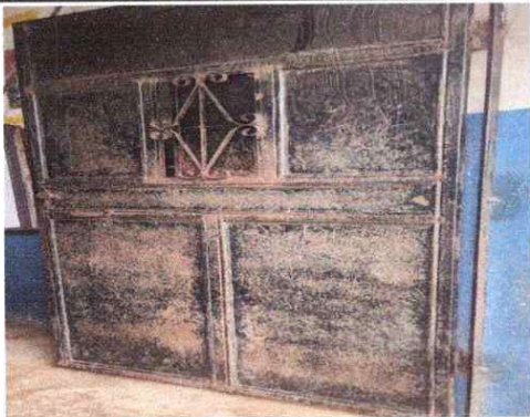
Sustitución de Puerta del (aula)