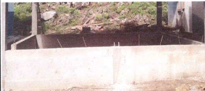
Reparación perimetral de block ,malla galvanizada y columnas (cocina)