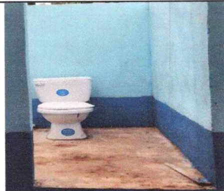
Sustitución de puerta en servicios sanitarios