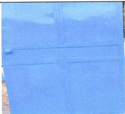
sustitución de puerta de madera por metal (cocina)