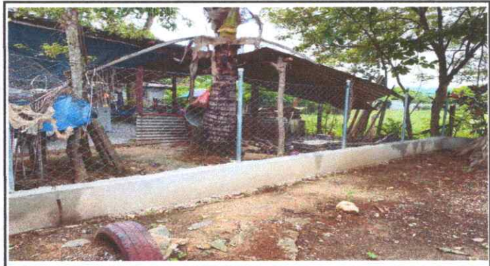
REPARACIÓN DE MURO PERIMETRAL Y SUSTITUCIÓN DE MALLA Y POSTES DE MADERA POR BLOC Y TUBO HG