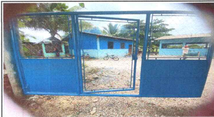
SUSTITUCIÓN DE PORTON DE METAL