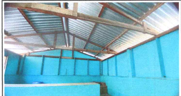
REPARACIÓN GLOBAL DE AREA DE COCINA

Observación: Si es necesario se pueden agregar hojas adicionales y actualizar el número de hojas.