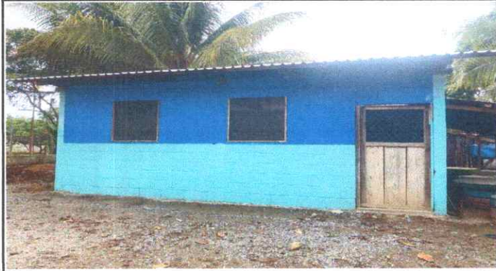
SUSTITUCIÓN DE LAMINA POR LAMINA TROQUELADA ALUZIN CALIBRE 26