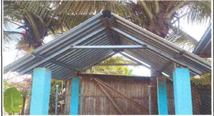
SUSTITUCIÓN DE TECHO DE MADERA POR METAL