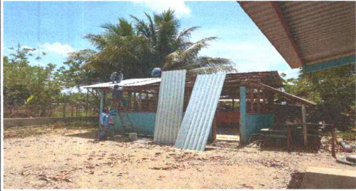
SUSTITUCIÓN DE LAMINA POR LAMINA TROQUELADA ALUZIN CALIBRE 26