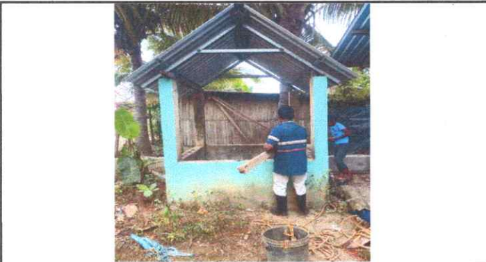
SUSTITUCIÓN DE BOMBA DE AGUA