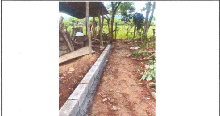
REPARACIÓN DE MURO PERIMETRAL Y SUSTITUCIÓN DE MALLA Y POSTES DE MADERA POR BLOC Y TUBO HG