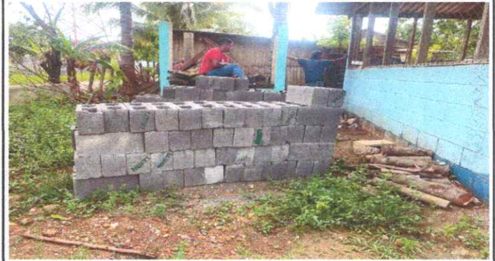
SUSTITUCIÓN DE TECHO DE MADERA POR METAL