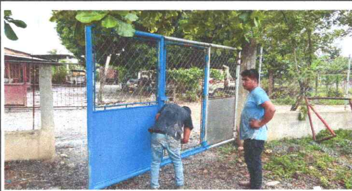
SUSTITUCIÓN DE PORTON DE METAL