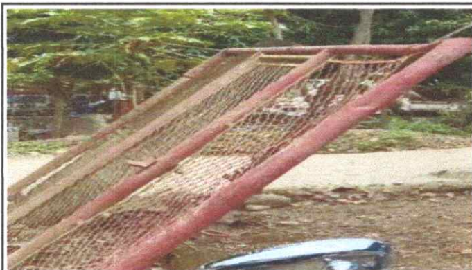
SUSTITUCIÓN DE PORTON DE METAL