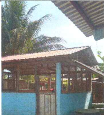
SUSTITUCIÓN DE LAMINA POR LAMINA TROQUELADA ALUZIN CALIBRE 26