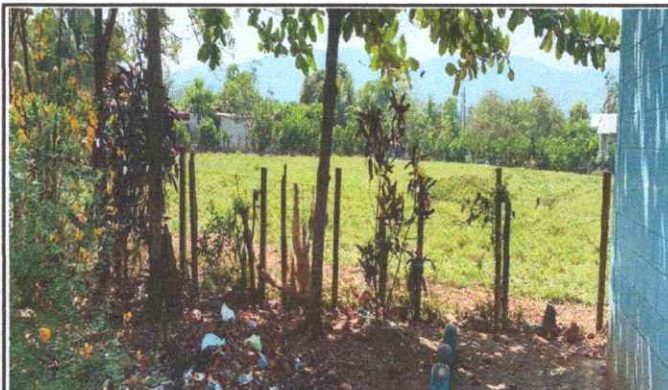
REPARACIÓN DE MURO PERIMETRAL Y SUSTITUCIÓN DE MALLA Y POSTES DE MADERA POR BLOC Y TUBO HG