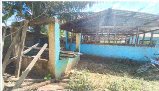
SUSTITUCIÓN DE TECHO DE MADERA POR METAL