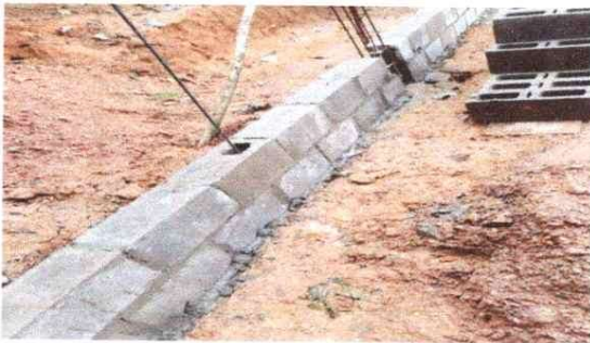
Sustitución de simiento y biga de humedad