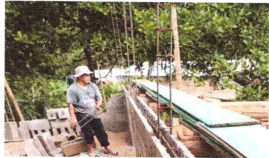
Sustitución de columnas