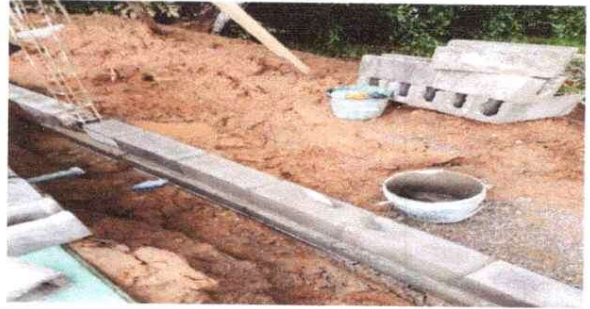
Sustitución de pared