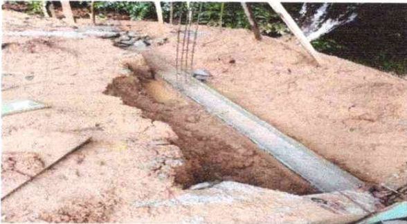
Sustitución de simiento