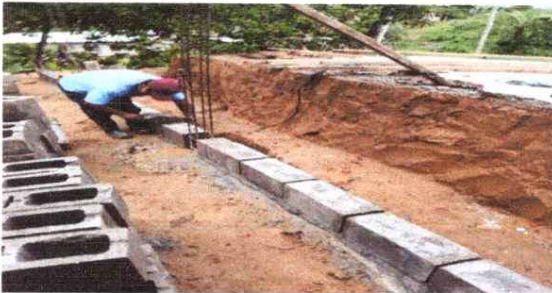
Sustitución de muro de contención