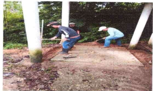
Sustitución de taza para baño

Observación: Si es necesario se pueden agregar hojas adicionales y actualizar el número de hojas.