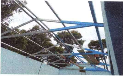
Sustitución de láminas