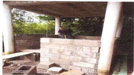
Sustitución de pared para baño

Observación: Si es necesario se pueden agregar hojas adicionales y actualizar el número de hojas.