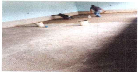
Sustitución de piso