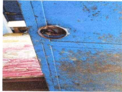
Sustitución de chapa para puertas