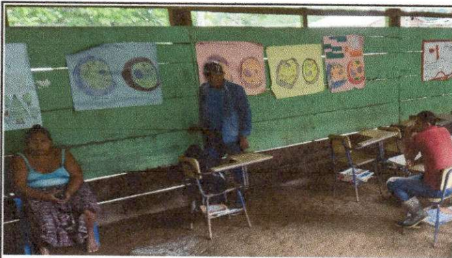
Foto 9: REMZAMIENTO DE AULA AMPLICION DE MURO CON REFUERZO ESTRUCTURAL.