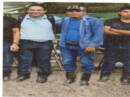
Foto 12: .EVALUADOR DE CAMPO CON AUTORIDADES DEL ESTABLECIMIENTO EDUCATIVO.

[Handwritten Signature] Firma y Sello del Presidente de la OPF