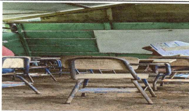
Foto 11 REMOZAMIENTO PISO , SUMINIISTRO E INSTALACION DE PISO CERAMICO ANTIDESLISANTE.