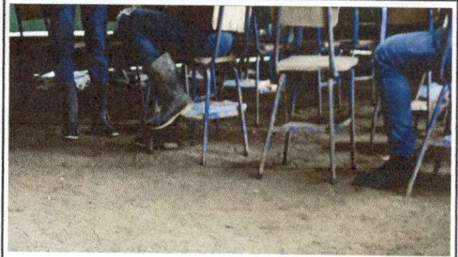
Foto 8 REMOZAMIENTO PISO , SUMINIISTRO E INSTALACION DE PISO CERAMICO ANTIDESLISANTE.