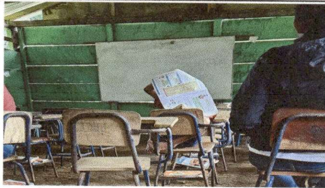
Foto 7: REMOZAMIENTO DE AULA SUMINISTRO E INSTALACION DE ESTRUCTURA METALICA Y LAMINA.