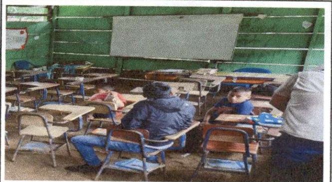
Foto 10: REMZAMIENTO DE AULA AMPLICION DE MURO CON REFUERZO ESTRUCTURAL.