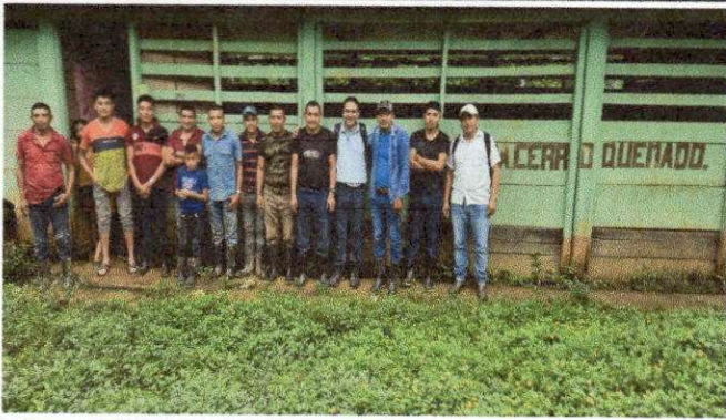
Foto 1: .EVALUADOR DE CAMPO CON AUTORIDADES DEL ESTABLECIMIENTO EDUCATIVO.