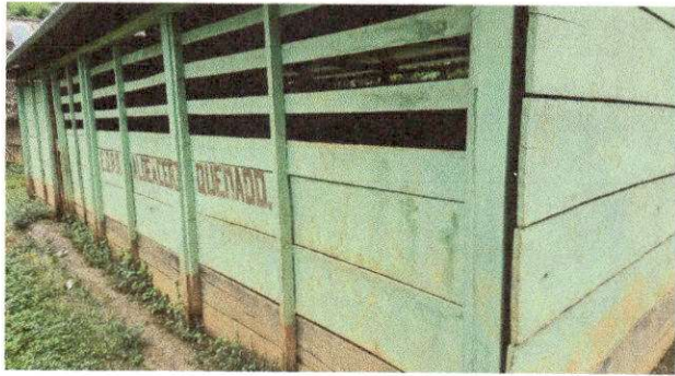
Foto 3: REMZAMIENTO DE AULA AMPLICION DE MURO CON REFUERZO ESTRUCTURAL.