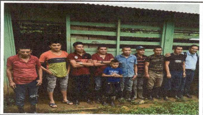
Foto 6: .EVALUADOR DE CAMPO CON AUTORIDADES DEL ESTABLECIMIENTO EDUCATIVO.