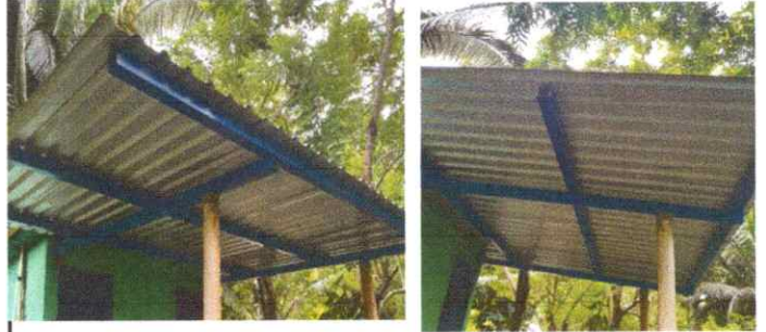
Fotografía 2: Estructura