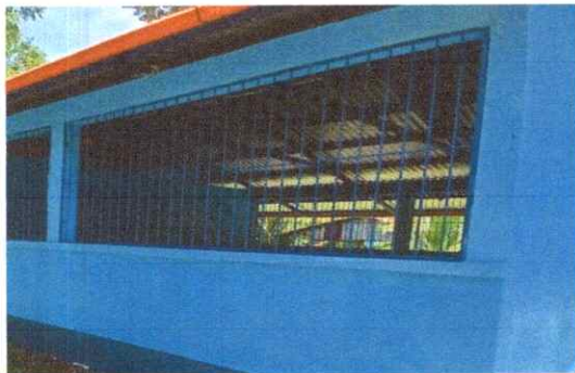
Fotografía 5: Ventanas