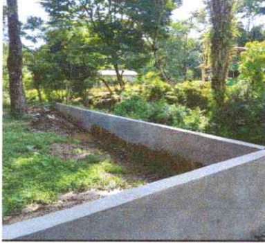
Fotografi 7: muro de contención