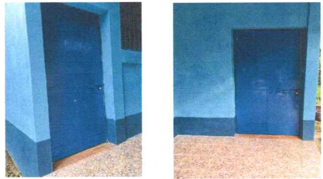
Fotografía 4: Puertas de Aulas