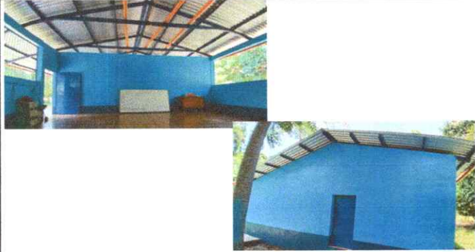
Fotografía 1: Láminas