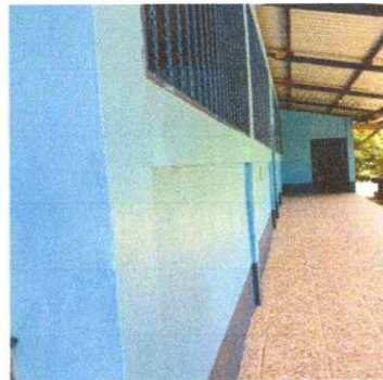
Fotografía 6: Piso

Observación: Si es necesario se pueden agregar hojas adicionales y actualizar el número de Hojas.